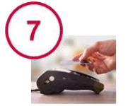
Gestion des paiements